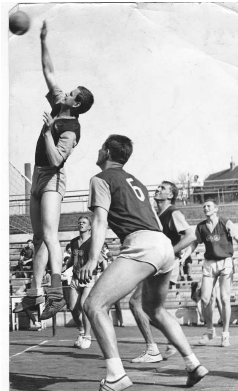
Ještě jedna vzpomínka na základní vojenskou službu v Dukle Kolín.

S Duklou jsem byl a zahrál si i na Poháru mistrů v holandském Haagu.