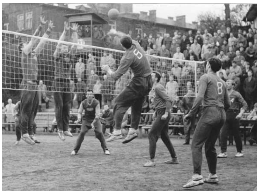
VŠ Praha – Dukla Kolín 1963 na Albertově

Extraligu jsme tehdy vyhráli s pětibodovým náskokem, hrál jsem téměř bez střídání. Zřejmě to byl můj největší sportovní úspěch. V době, kdy bylo velmi obtížné se dostat do země na západ od našich hranic, jsme hráli Pohár mistrů v Portugalsku (oba zápasy, byli jsme tam týden) a několikrát jsme hráli i v Paříži, Vídni apod. Byl jsem tenkrát i v nejširším výběru národního družstva pro OH v Tokiu 1964 a s národním B družstvem jsem odehrál „Pohár osvobození Bratislavy“.